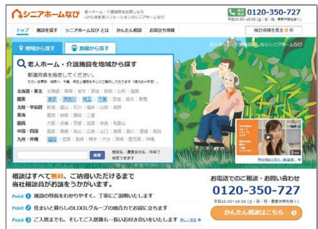
「シニアホームなび」トップページ

※このリリースは、国土交通記者会、国土交通省建設専門紙記者会にお届けし、ホームページ（URL： http://www.lixil-living-solution.co.jp/ ）でも発表しています。